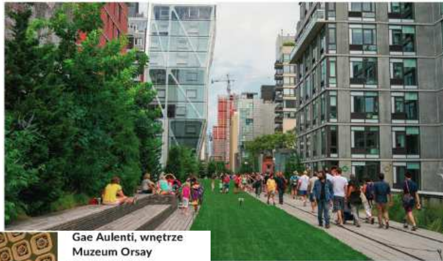
James Corner [czyt.: dżejms korner], park High Line [czyt.: haj lajn] w Nowym Jorku, XXI w.

Architektura jest dziedziną sztuki, w której dziełami sztuki są różnorodne obiekty budowlane, projektowane z uwzględnieniem ich przeznaczenia oraz warunków w danym miejscu. Można rzec, że architekci kształtują przestrzeń życia człowieka. Podczas planowania budynków i ich otoczenia muszą dostosować swoją koncepcję do funkcji, jaką te obiekty mają pełnić. Biorą pod uwagę: ludzkie potrzeby, tryb życia, codzienne czynności. Dlatego inaczej wyglądają kościół, kino czy szkoła.