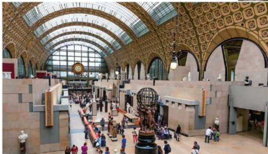
Gae Aulenti , wnętrze Muzeum Orsay w Paryżu, XX w.

Zadaniem architektów jest dbanie o to, byśmy mogli wygodnie dotrzeć w różne miejsca w mieście oraz spacerować i odpoczywać. W Nowym Jorku dawny wiadukt metra biegnący wśród wieżowców zagospodarowano zielenią z myślą o potrzebie relaksu przechodniów.