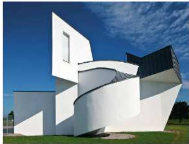
Frank O. Gehry [czyt.: geri], budynek Muzeum Dizajnu Vitra w Weil [czyt.: wail] nad Renem w Niemczech, XX w. – budowla w niewielkiej skali, wyróżniająca się z otoczenia, o nieregularnej, dekoracyjnej bryle